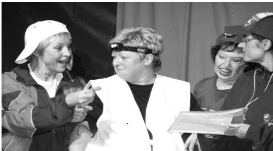
Sct. Hans'erne har en årelang tradition for at sætte revyer op. Arkivfoto fra revyen i 2009.

Sct. Hans'ernes rablende revyhold er klar til at brage ud over scenekanten med Skibhusrevyen 2012 i marts.